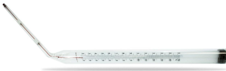
Рисунок 2 - Общий вид термометров максимальных стеклянных ТТЖ-М исп. 2

Архангельск (8182)63-90-72 Астана (7172)727-132 Астрахань (8512)99-46-04 Барнаул (3852)73-04-60 Белгород (4722)40-23-64 Брянск (4832)59-03-52 Владивосток (423)249-28-31 Волгоград (844)278-03-48 Вологда (8172)26-41-59 Воронеж (473)204-51-73 Екатеринбург (343)384-55-89 Иваново (4932)77-34-06